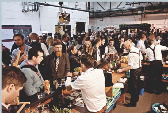
Bar Convent Berlin