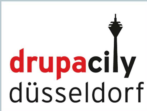
Events am Standort